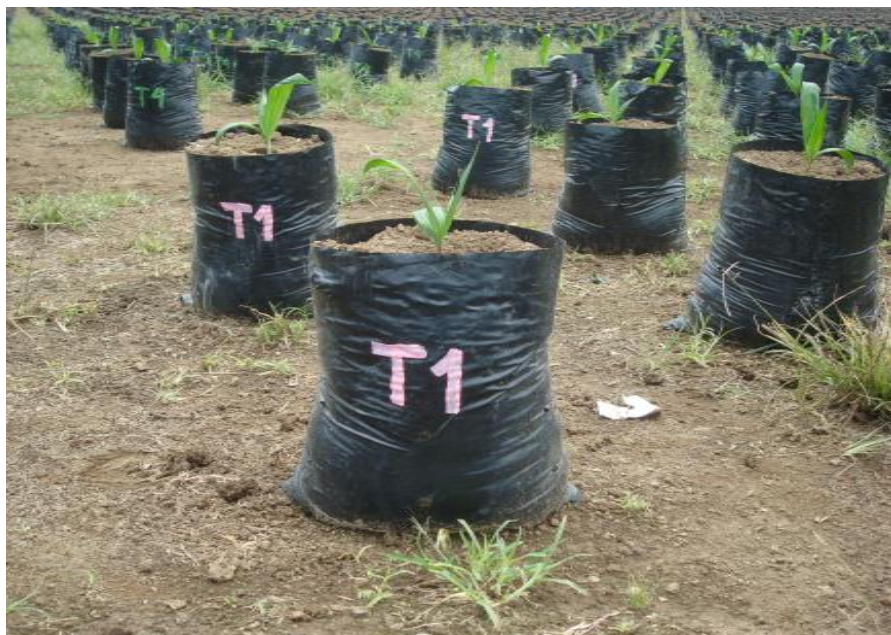
Figura 6. Plantas en vivero. Shushufindi, 2012.