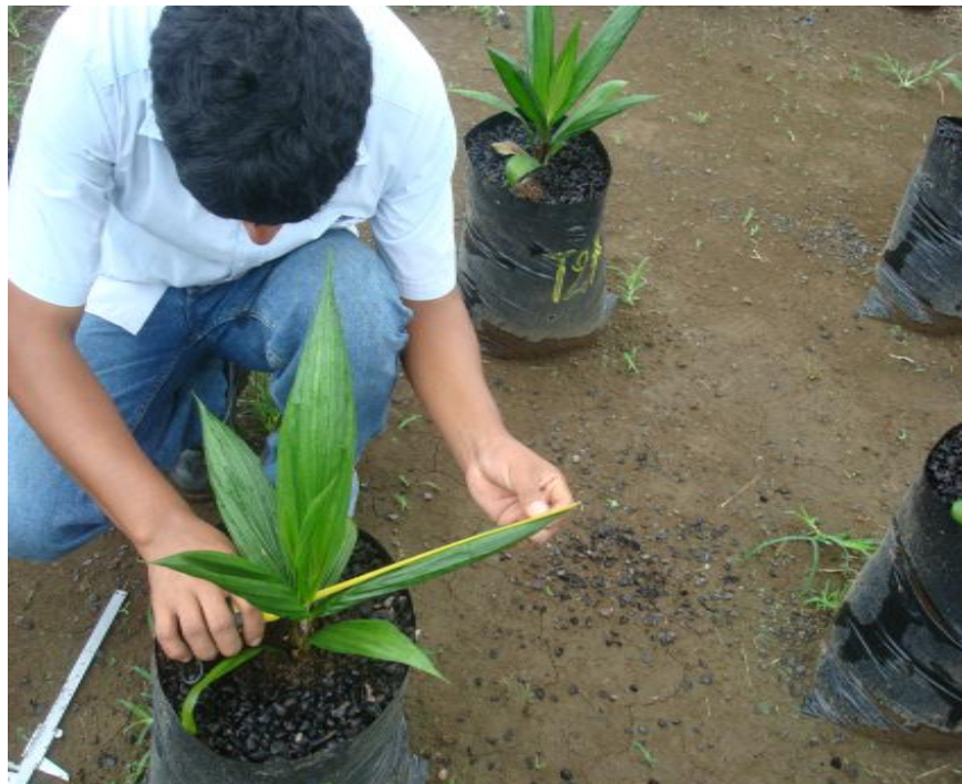
Figura 8. Medición de la hoja número 4. Shushufindi, 2012.