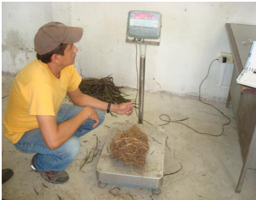
Figura 14. Peso de raíz en seco. Shushufindi, 2013.