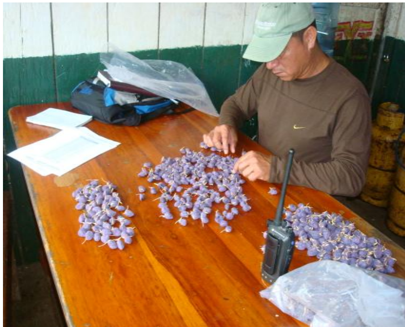
Figura 2. Clasificación de semillas. Shushufindi, 2012.