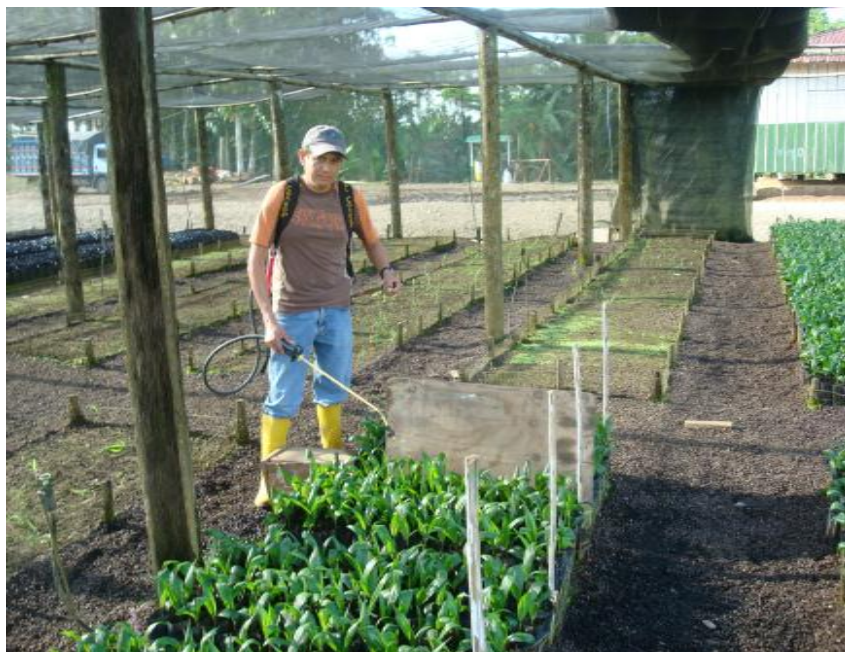
Figura 5. Aplicación de fungicida. Shushufindi, 2012.