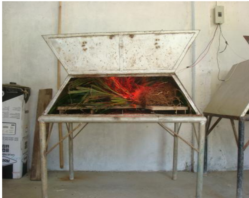
Figura 12. Secado de plantas en estufa. Shushufindi, 2013.