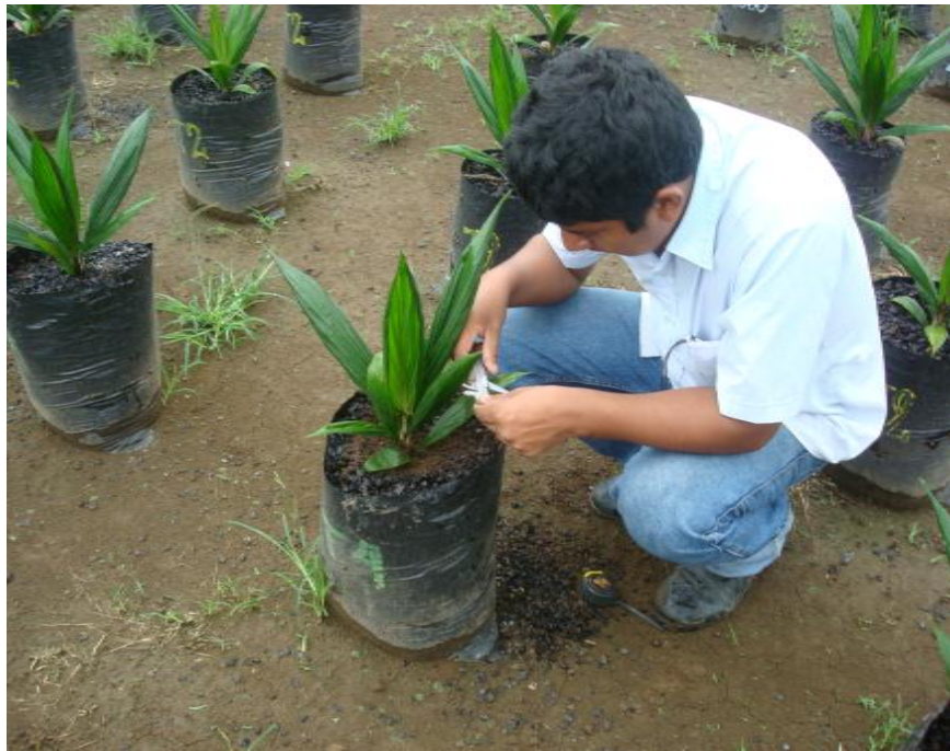
Figura 7. Medición del estípote. Shushufindi, 2012.