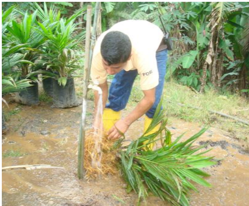
Figura 10. Lavado de raíces. Shushufindi, 2013.