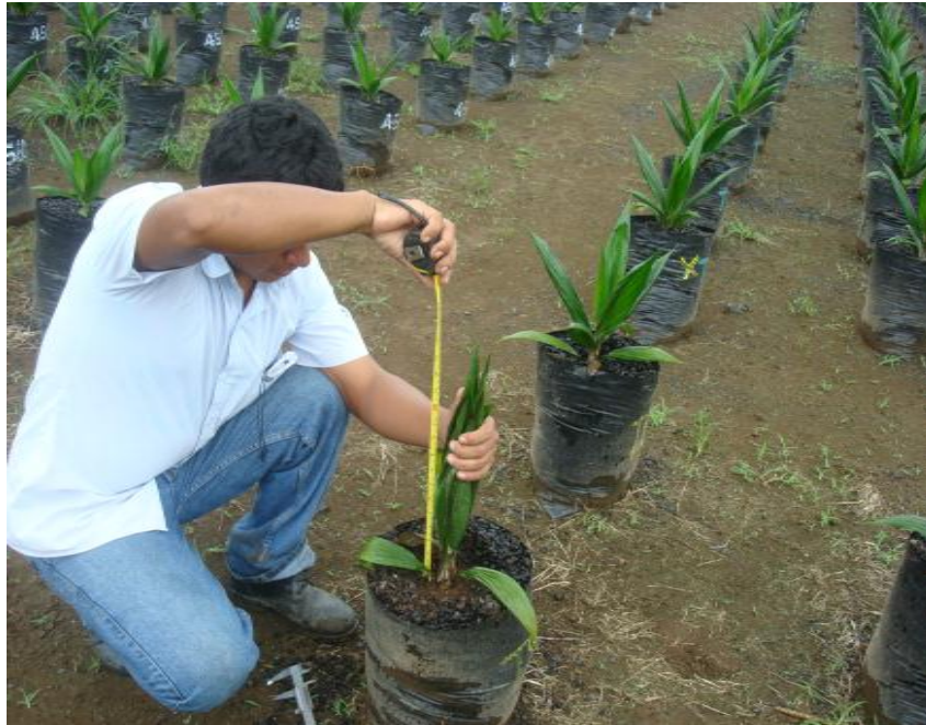
Figura 9. Medición de la altura total de la planta. Shushufindi, 2012.