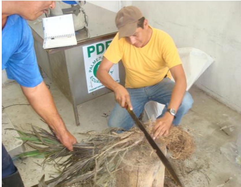
Figura 13. Corte de raíz. Shushufindi, 2013.