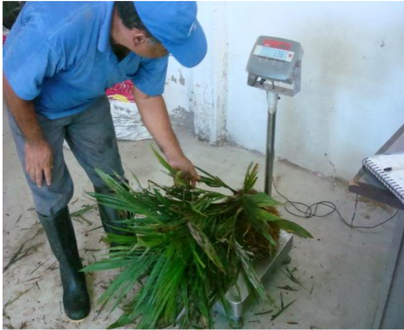
Figura 11. Peso de plantas en fresco. Shushufindi, 2013.