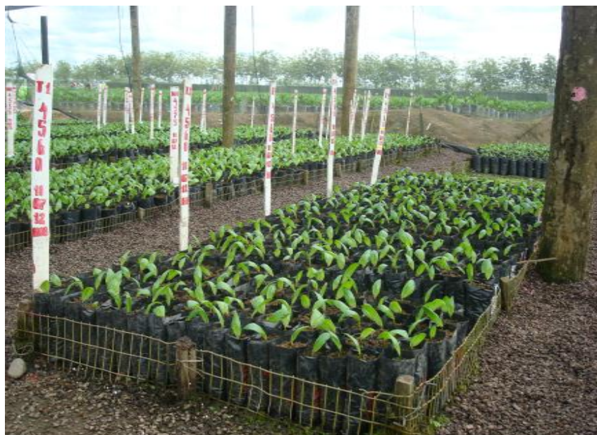
Figura 4. Plantas germinadas (1 mes). Shushufindi, 2012.