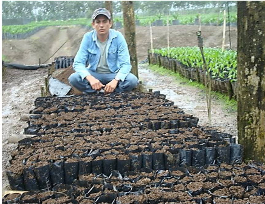
Figura 1. Llenado de fundas en previvero. Shushufindi, 2012.